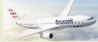
Wir fliegen mit Brussels airlines - Star Alliance

Wir starten morgens in Frankfurt um 7.40 Uhr mit Brüssel Airlines nach Brüssel. Um 10.40 Uhr hebt unsere Maschine Richtung Entebbe/ Kampala ab. Um 23.15 Uhr landen wir mit nur einer Stunde Zeitverschiebung in Entebbe. Unser Transfer bringt uns direkt in unser Hotel von "Vision for Africa" nach Mukono. (Transferzeit 90 Minuten)