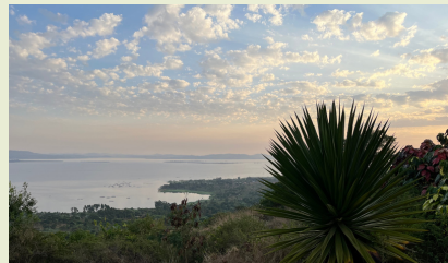
Retreat & Training Prayer Mountain in Jinja

Nach einem fantastischen Sonnenaufgang am Viktoriasee machen wir uns auf den Weg zum Innovation Village, wo wir auf inspirierende Unternehmensgründer treffen werden. Anschließend gibt es ein gemeinsames "Farewell" Mittagessen mit Reflektion und Follow-Up Ideen. Am Nachmittag geht es dann Richtung Flughafen, wo wir um 23.15 Uhr Richtung Frankfurt über Brüssel abheben. Ankunft: Donnerstag, 08.02.24, um 10.30 Uhr in Frankfurt.