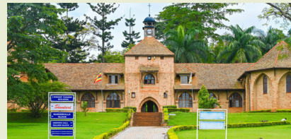
Besuch Business School UCU

Am Vormittag sind wir zu Gast an der UCU- University in Mukono. Wir erhalten Einblick in das ugandische Bildungssystem und tauschen uns mit High-Potentials aus. Die Business School mit Incubation Hub unterstützt Entrepreneurre bei der Unternehmensgründung. Am Nachmittag besuchen wir europäische Unternehmen. Mit dabei ist eines der größten Export Unternehmen, welches bereits 30 Jahre in Uganda tätig ist. Sowie ein Bambus Start-Up. Am Abend reisen wir weiter nach Jinja auf den Prayer Mountain.