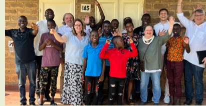
Mittagessen bei einer lokalen Watoto Familie

Am Morgen besuchen wir den Gottesdienst der Watoto-Church in Kampala. Die Kirche zählt zu den größten NGOs im Land und bildet zukünftige Leiter in Uganda aus. Wir besuchen ein "Children-Village" in Subbi und sind zum Mittagessen zu Gast bei einer ugandischen Familie. Am Nachmittag geht es zurück nach Kampala und wir besuchen Abends das Ndere Kulturzentrum. Dort erwartet uns ugandische Kultur mit Tanz und Musik.