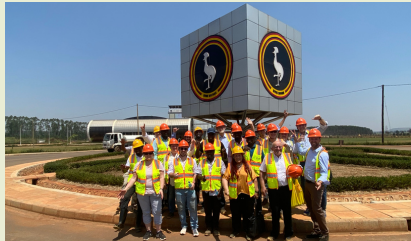
Kiira Motors - der Elektro Pionier

Der Tag startet mit einer Besichtigung des Industrieunternehmens Kiira Motors. Das Unternehmen ist ein Pionier im Bau von Elektrofahrzeugen. Die Vision von Kiira ist es, Afrika mobil zu machen durch Elektromobilität. Am Nachmittag gibt es eine Stadtbesichtigung in Jinja und eine Bootsfahrt auf dem Nil. Am Abend erwartet uns ein Lagerfeuer auf dem Prayer Mountain for Leaders.